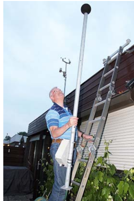
Daar gaat ie dan, na 10 jaar onafhankelijk meten.

gaat gebeuren. Misschien komt er dan meer duidelijkheid.