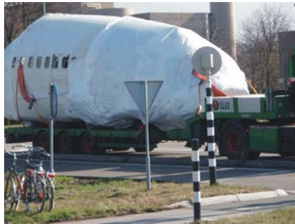
Het vliegtuig op transport naar schiphol