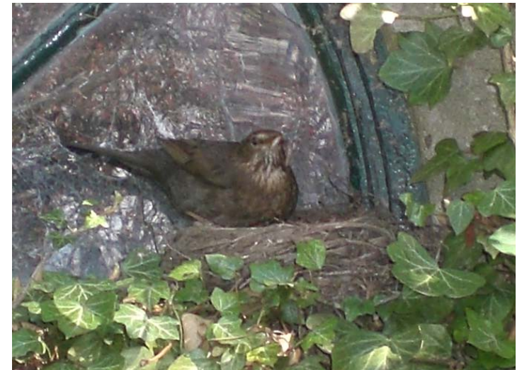
Echt, deze merel heeft een worm in zijn bek om de jongen te voeden