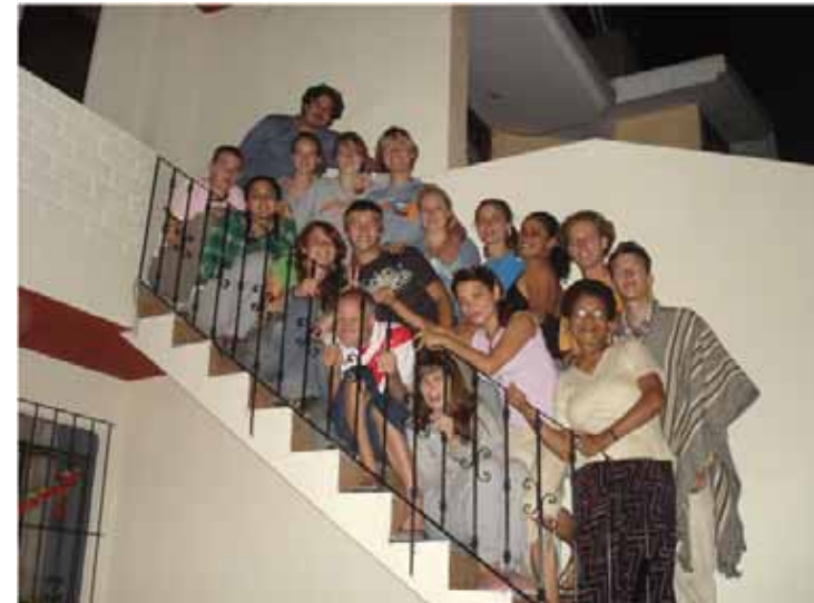
groepsfoto in Peru

Het verkeer in Lima is een verhaal apart. Je ontdekt daar dat er op een driebaansweg makkelijk zes auto's naast elkaar passen, en dan kun je ook nog inhalen. Als een politiemotor niet snel genoeg gaat naar je zin, dan rijd je hem gewoon toeterend voorbij; toeteren doe je trouwens bij alles, bij een kruising, als je gaat rijden, als je een toerist ziet, enzovoort. Bushaltes zijn helemaal niet nodig, als er mensen langs de weg staan, stoppen er gewoon zes busjes. Die busjes zijn overigens zo klein dat ik met mijn 1 meter 65 er niet eens rechtop in kan staan, maar er passen wel heel veel mensen in als je gewoon een beetje probeert.