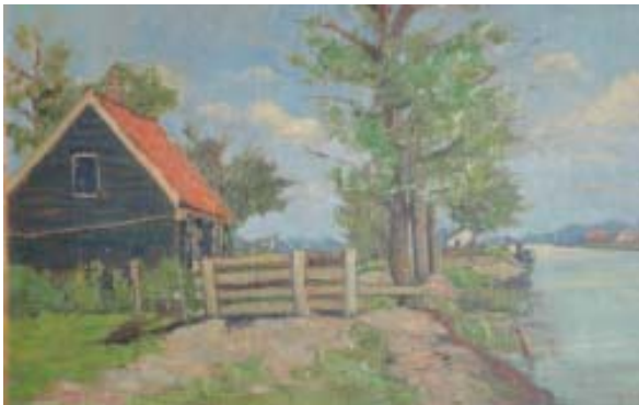
Schilderij van het huisje

Na 1930 verhuisde het gezin naar Amsterdam.