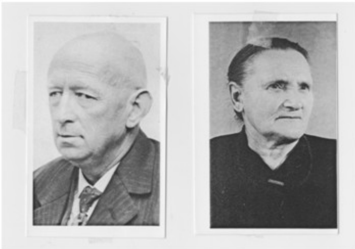
opa en oma Pijlman