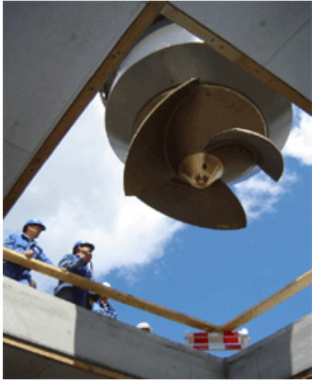
Het plaatsen van de pomp in het nieuwe gemaal